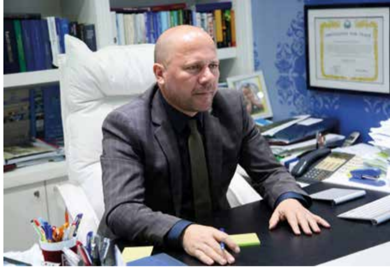
në zhvillimin e drejtë, duke ruajtur trendin e përvitshëm të qytetit. Ruajtja e trendit të zhvillimit të qytetit sigurisht

Së treti ai kërkoi nga ana e drejtuesve të jenë kreativë